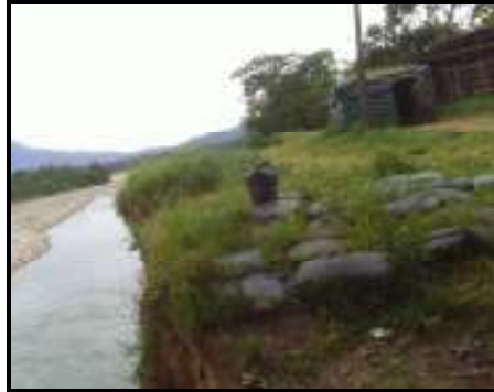
Foto 4. Área de ronda del río Cobaría