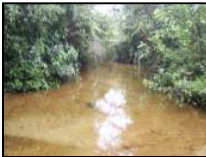
Foto 1. Quebrada Fátima