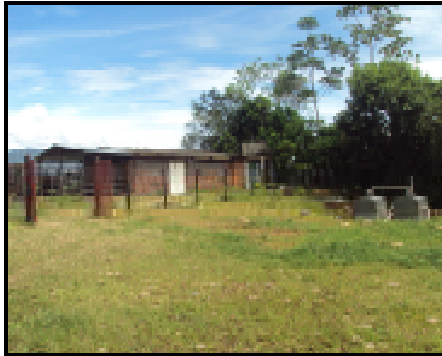
Foto 3. Matadero