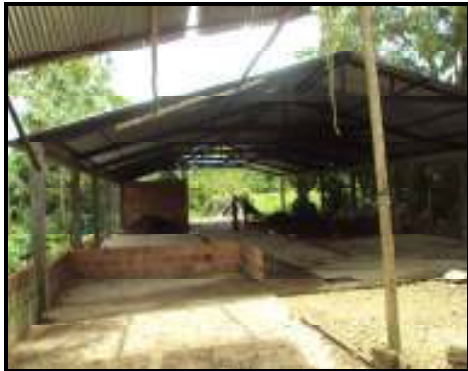
Foto 5. Zona de Compostaje

El Municipio de Cubara viene emprendiendo algunas acciones y actividades a la Implementación del PGIRS como las actividades de aprovechamiento de los residuos para compostaje y reciclaje, pero se encuentra incumpliendo la normatividad ambiental vigente en materia de disposición final del material no aprovechable.