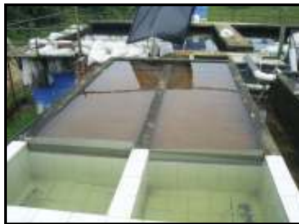
Foto 2. PTAP